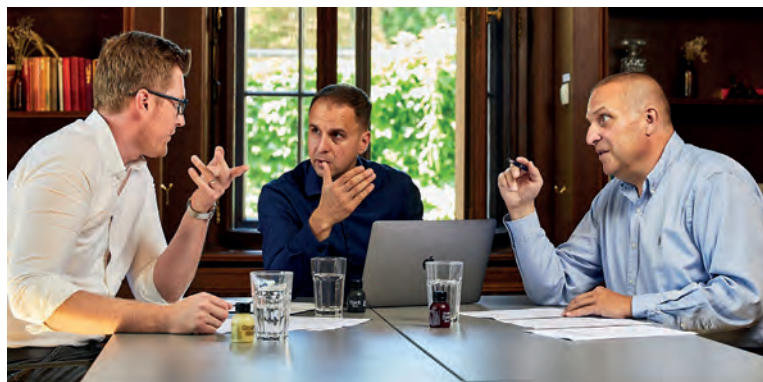
Fotka z jednání startupu OutdoorTrip, iniciativy Zachraňme turismus a RIX Group, kde bylo podepsáno i memorandum o spolupráci.

Pandemie koronaviru dopadla velmi tvrdě na velké množství oborů a oblastí lidské činnosti. Mezi nejpostiženější patří jednoznačně sektor cestovního ruchu a turismu. Platforma Zachraňme turismus , která vznikla v průběhu letošního jara, si klade za cíl pomoci poskytovatelům služeb v Česku. Jednou z hlavních aktivit této iniciativy je vytvoření systému voucherů umístěných na trh prostřednictvím obchodních kampaní společností, které mají zájem pomoci tuzemskému turismu a zapojit se do zajímavého projektu „ušlechtilých cílů“.