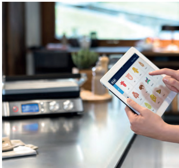
Nový kontaktní gril s velkou grilovací plochou a aplikací.