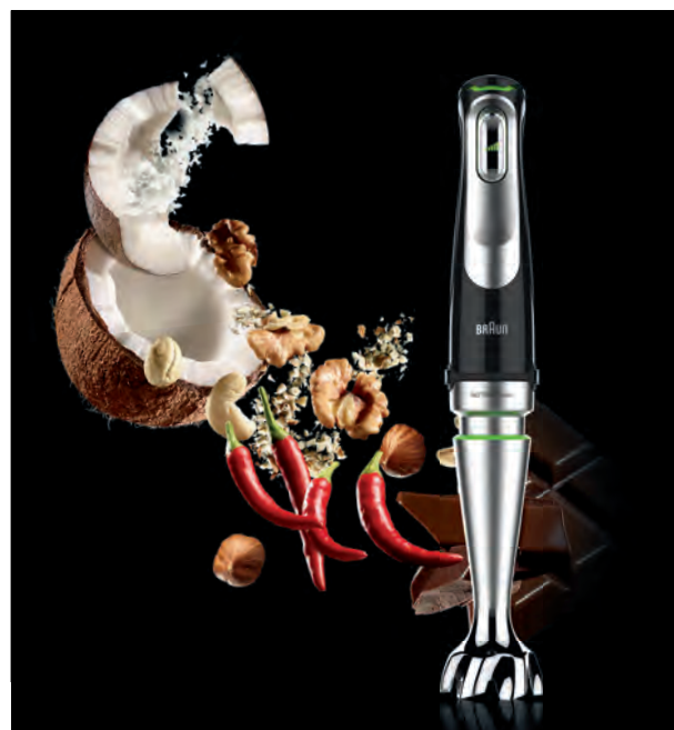
Nová generace tyčových mixérů s patentovanou technologií ACTIVEBlade.

jete s menším úsilím. Díky speciálnímu tvaru zvonu PowerBell Plus a funkci proti rozstříku SPLASHControl jsou pokrmy bez stříkání perfektně rozmixovány, a to i bez nepořádku v kuchyni. MultiQuick 9 tak není pouhým tyčovým mixérem, ale multifunkčním pomocníkem do kuchyně, který zvládne rozmixovat téměř vše.